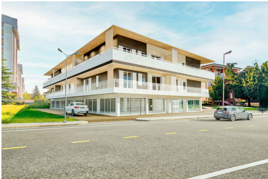
Vista su Via San Mauro